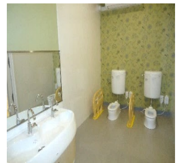
沐浴 ・ シャワー室